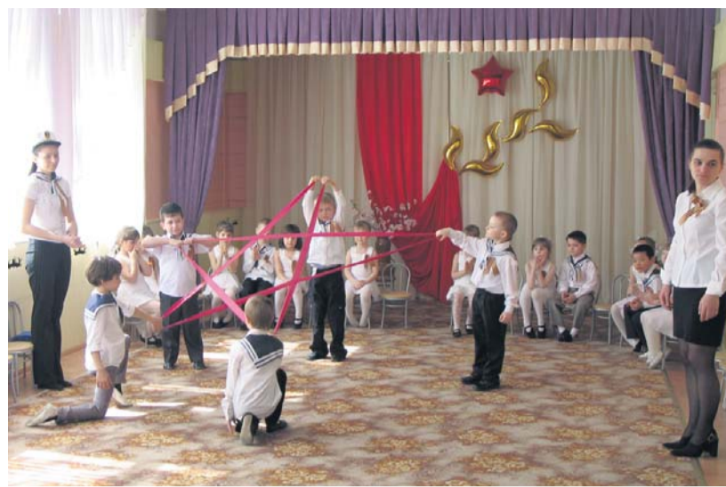
Детский сад № 2041

«Мир удивительных друзей – 2» – это не просто цирковое представление, это философская сказка. Мальчик – главный герой, живет в благополучной семье, но, к сожалению, совершенно одинок. Основное действие спектакля разворачивается с молниеносной быстротой и яркостью детского сна. Индейцы подхватят мальчика и с