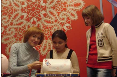
Работы, созданные детьми на основе изучения народного искусства, несут печать ручного труда, они душевные и неповторимые.

кому проникновению в народное творчество, являются экспедиции в различные центры художественных промыслов, прививающие детям любовь к народному искусству. Ребята и их руководители побывали в Архангельске, Вологде, Кириллове, Псковской обл., Великом и Нижнем Новгороде, Ярославле, Липецке, Ельце, Торжке, Калуге, Рязани, на Валдае, в Тарусе. Яркие жизнеутверждающие образы народного искусства становятся ближе и понятнее ребятам, четкий и ясный народный орнамент оживает на современных изделиях, созданных юными мастерами.