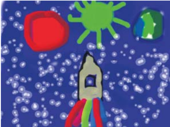
Земляне в открытом космосе. Автор – Пашков Алексей, 9 лет

Мы продолжаем публиковать работы юных жителей Гагаринского района, посвященные Году российской космонавтики.