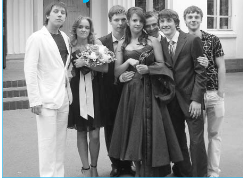
Выпускники школы №198

23 июня во всех московских школах прошли выпускные вечера. Во время торжественной части состоялось вручение аттестатов, золотых и серебряных медалей, похвальных листов. Всего в этом году школы Гагаринского района окончили около 500 юношей и девушек. Блестяще окончили школы 40 выпускников («золото» – 15 человек, «серебро» – 25). Больше всего медалистов в школе № 26 – 8 ребят. В лицее № 1525 – 7 медалистов, а в гимназии № 1265 – 6.