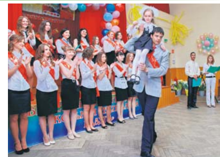
Выпуск - 2011. Школа № 522

Совсем скоро начнутся школьные выпускные экзамены, а следом и вступительные в вузы. Ребятам понадобится много сил, знаний и терпения, чтобы преодолеть эти серьезные испытания. Но уверена, у наших мальчишек и девочек все получится! И впереди их ждет прекрасная романтическая студенческая жизнь. Но родная школа, как первая любовь, не забудется никогда. Они еще долго будут именовать себя одноклассниками, приходить в гости к