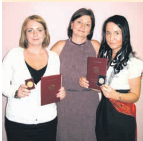
Медалистки 2012 года школы № 568.

Мы поздравляем всех выпускников этого года и желаем им «ни пуха, ни пера!»